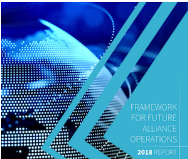
FFAO 2018 Report

https://www.act.nato.int/images/stories/media/doclibrary/ffao-2015.pdf