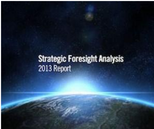
SFA 2013 Report

Oryginały raportów SFA dostępne są na stronie ACT pod adresem: