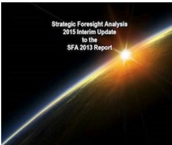
SFA 2015 Interim Update

https://www.act.nato.int/images/stories/media/doclibrary/sfa_security_implications.pdf