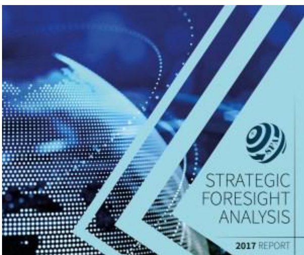
SFA 2017 Report

https://www.act.nato.int/images/stories/media/doclibrary/160121sfa.pdf